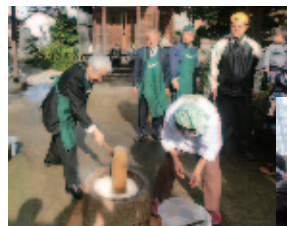
木津だいこんまつり