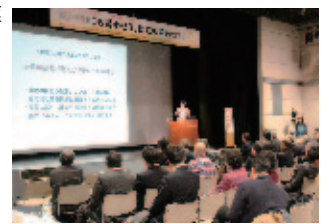
地方創生・街づくりトーク