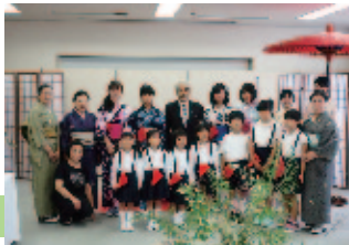
こども生活文化祭