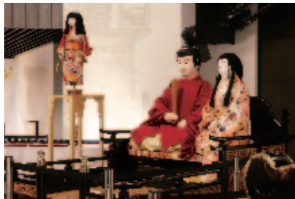
平成の御車山 本座・相座(人形)