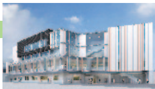
高岡駅前東地区複合ビル (イメージベース)