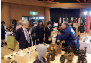
全国伝統的工芸品フェスタ in 富山