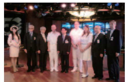
ダイヤモンドプリンセス号歓迎式典