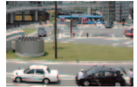
万葉線・タクシー