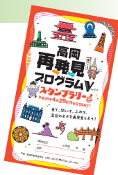
高岡再発見プログラムV