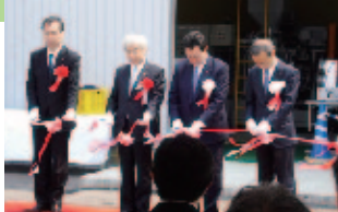
アルハイテックプラント完成披露会