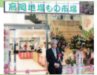
高岡地場もの市場