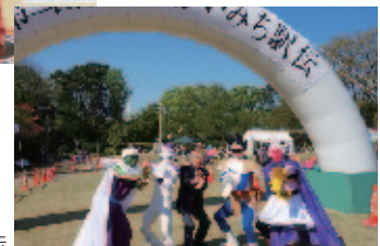
高岡ねがいみち駅伝