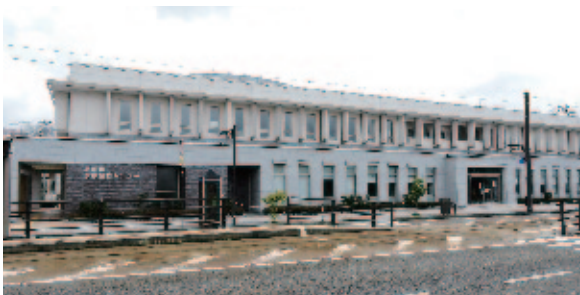
高岡市 急患医療センター