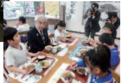
成美小学校 昆布飯試食会