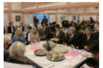
アーティストレジデンス