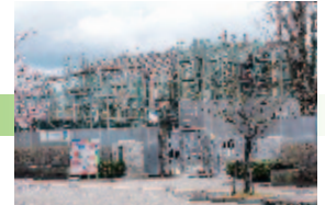
志貴野中学校 改築工事