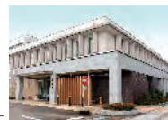
高岡市急患医療センター