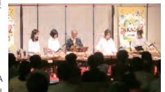
ユニークベニュー-TAKAOKA「オンまちなかステージ」