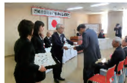
市農林水産業功労者表彰