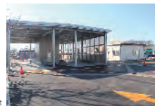
ストックヤード整備事業