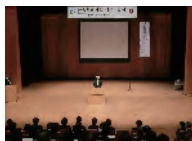
教育共創セミナー