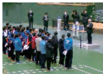
バドミントン日本代表選手 ジュニア代表強化合宿歓迎 セレモニー