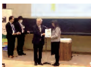
とやま呉西圏域共創ビジネス研究所修了式