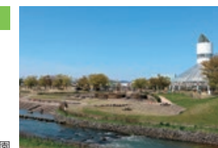
高岡おとぎの森公園