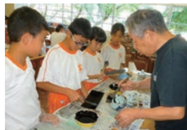
ものづくり デザイン科