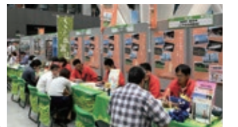
移住・定住促進イベント